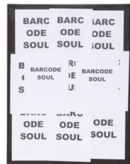
HYPER-POEM PAINTING (BARCODESOUL)

Graphite, paper, glue and acrylic on canvas